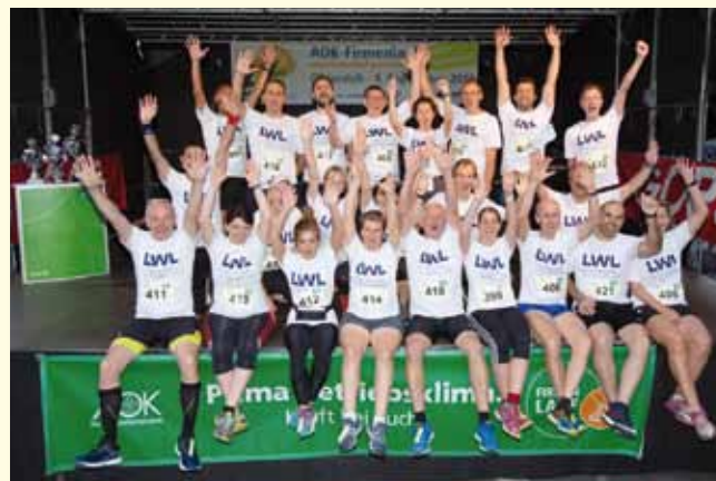
Stammgäste beim Firmenlauf Gütersloh: Das Team der LWL-Kliniken.

Weder der Veranstalter, Ausrichter, Sponsoren, die Stadt Gütersloh oder deren Vertreter, übernehmen Haftung bei Schäden jeglicher Art. Dies gilt auch für Unfälle, abhanden gekommene Bekleidungsstücke oder sonstige Gegenstände. Gesundheitliche Risiken dürfen Teilnehmer nicht eingehen. Es obliegt den Teilnehmern, ihren Gesundheitszustand vorher gründlich überprüfen zu lassen. Bei Nichtteilnahme oder Ausfall der Veranstaltung durch höhere Gewalt besteht kein Anspruch auf Rückerstattung der Organisationsgebühr. Der Teilnehmer gestattet dem Veranstalter die Nennung des Namens in Ergebnis- und Teilnehmerlisten sowie die Nutzung von Event-Fotos, sofern dies in Zusammenhang mit dieser Veranstaltung steht.