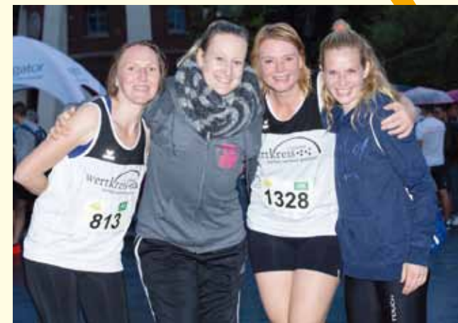
Firmenlauf 2019: Gute Laune trotz Regen.