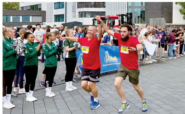
Hand-in-Hand: einmalig schönes Einlauf-Erlebnis.

Weder der Veranstalter, Ausrichter, Sponsoren, die Stadt Gütersloh oder deren Vertreter, übernehmen Haftung bei Schäden jeglicher Art. Dies gilt auch für Unfälle, abhanden gekommene Bekleidungsstücke oder sonstige Gegenstände. Gesundheitliche Risiken dürfen Teilnehmer nicht eingehen. Es obliegt den Teilnehmern, ihren Gesundheitszustand vorher gründlich überprüfen zu lassen. Bei Nichtteilnahme oder Ausfall der Veranstaltung durch höhere Gewalt besteht kein Anspruch auf Rückerstattung der Organisationsgebühr. Der Teilnehmer gestattet dem Veranstalter die Nennung des Namens in Ergebnis- und Teilnehmerlisten sowie die Nutzung von Event-Fotos, sofern dies in Zusammenhang mit dieser Veranstaltung steht.