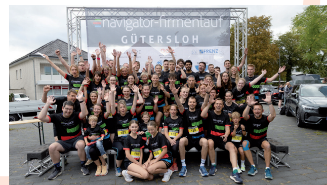
Namensgeber: Die Navigator-Gruppe ist mit vielen Läuferinnen und Läufern vertreten.