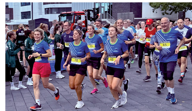
Das Reinhard-Mohn-Berufskolleg läuft als ganzes Team ein.

Jede Firma benennt einen Teamkapitän, der für die Koordination der Kolleginnen und Kollegen, wie z. B. die Anmeldung usw. zuständig ist.