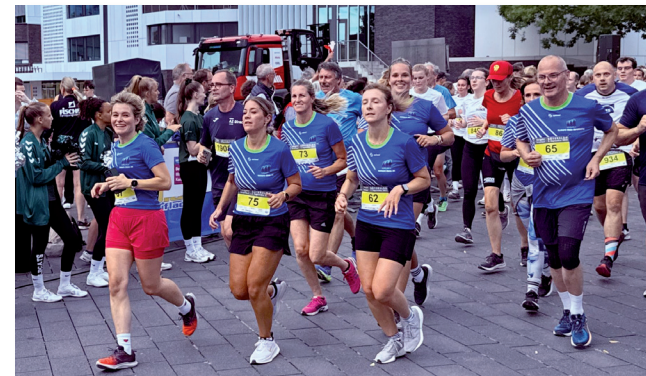
Das Reinhard-Mohn-Berufskolleg läuft als ganzes Team ein.

Jede Firma benennt einen Teamkapitän, der für die Koordination der Kolleginnen und Kollegen, wie z. B. die Anmeldung usw. zuständig ist.