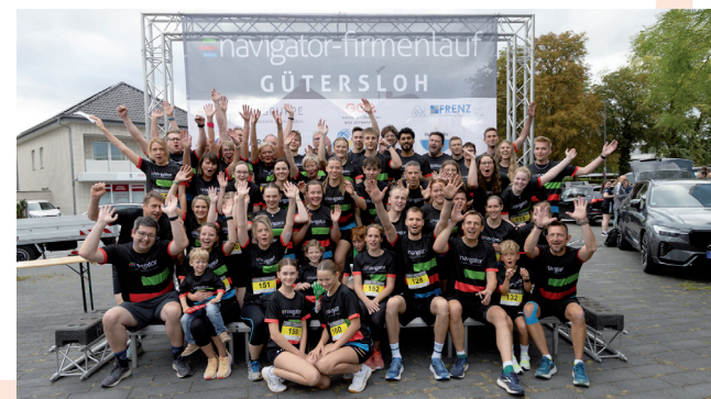
Namensgeber: Die Navigator-Gruppe ist mit vielen Läuferinnen und Läufern vertreten.