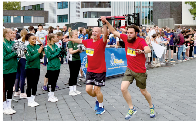
Hand-in-Hand: einmalig schönes Einlauf-Erlebnis.

Weder der Veranstalter, Ausrichter, Sponsoren, die Stadt Gütersloh oder deren Vertreter, übernehmen Haftung bei Schäden jeglicher Art. Dies gilt auch für Unfälle, abhanden gekommene Bekleidungsstücke oder sonstige Gegenstände. Gesundheitliche Risiken dürfen Teilnehmer nicht eingehen. Es obliegt den Teilnehmern, ihren Gesundheitszustand vorher gründlich überprüfen zu lassen. Bei Nichtteilnahme oder Ausfall der Veranstaltung durch höhere Gewalt besteht kein Anspruch auf Rückerstattung der Organisationsgebühr. Der Teilnehmer gestattet dem Veranstalter die Nennung des Namens in Ergebnis- und Teilnehmerlisten sowie die Nutzung von Event-Fotos, sofern dies in Zusammenhang mit dieser Veranstaltung steht.